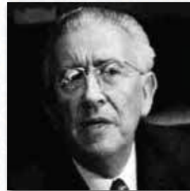
Dr. Maurice Bucaille